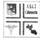
ASP n° 2