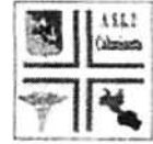
ASP n° 2